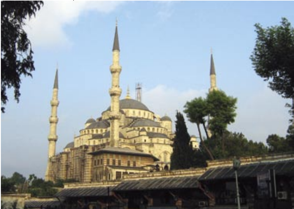
Veduta intera della celebre Moschea blu.