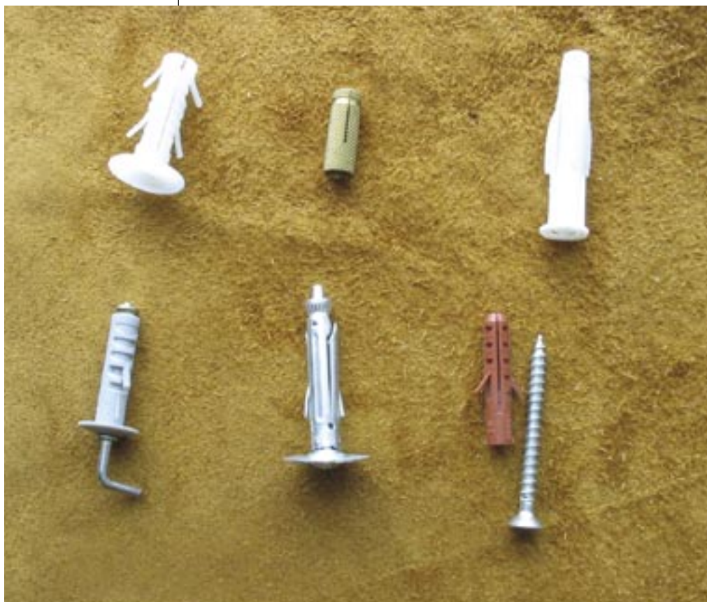
I tasselli di fissaggio si distinguono in due principali categorie: in materiale plastico e metallico